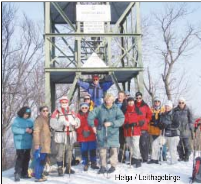
Helga / Leithagebirge