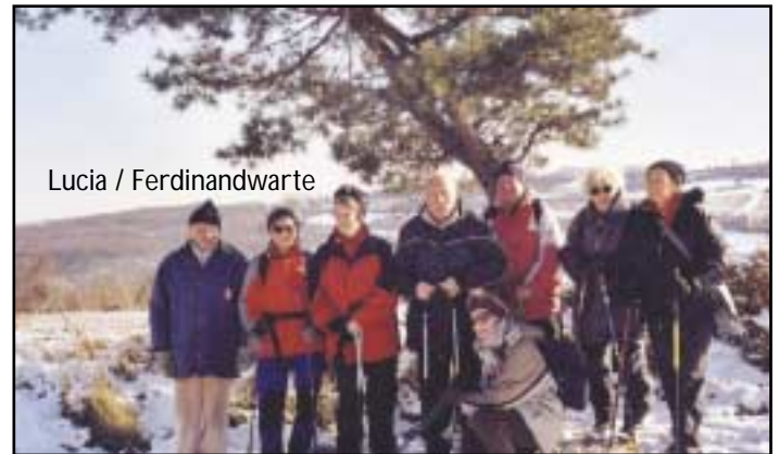
Lucia / Ferdinandswarte