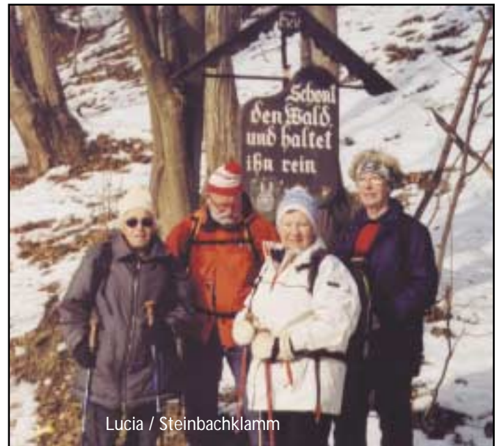
Lucia / Steinbachklamm