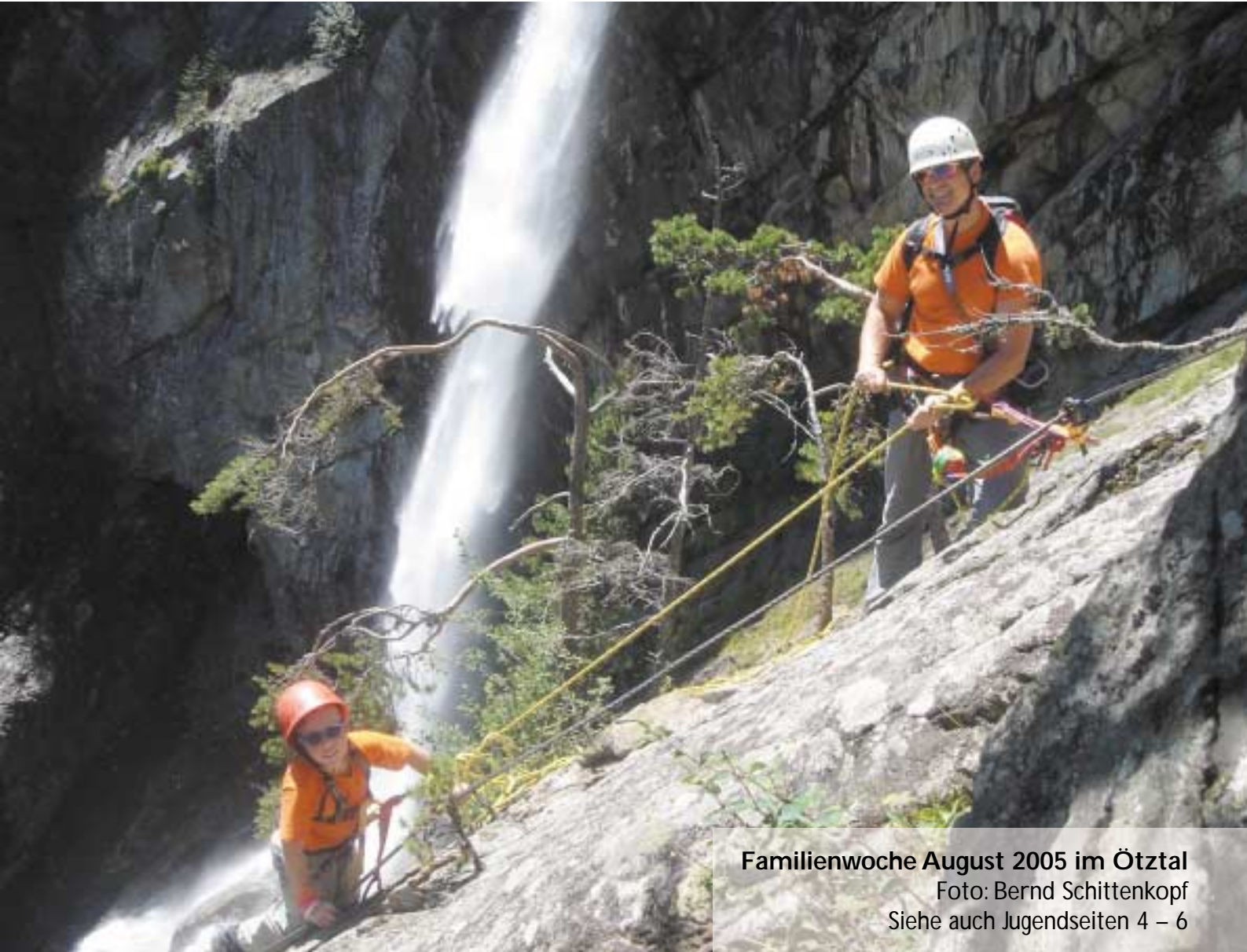
Familienwoche August 2005 im Ötztal Siehe auch Jugendseiten 4 – 6