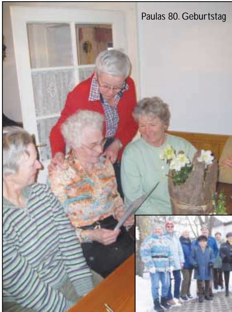
Paulas 80. Geburtstag