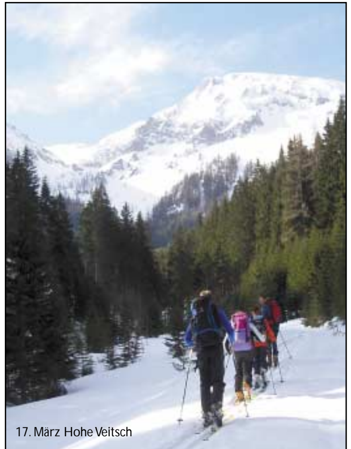
17. März Hohe Veitsch