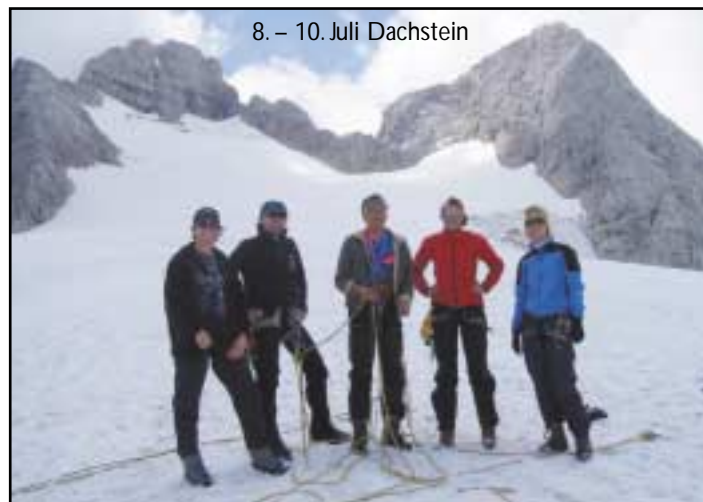
8. – 10. Juli Dachstein