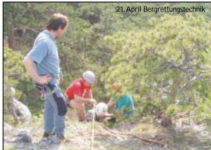
21. April Bergrettungstechnik