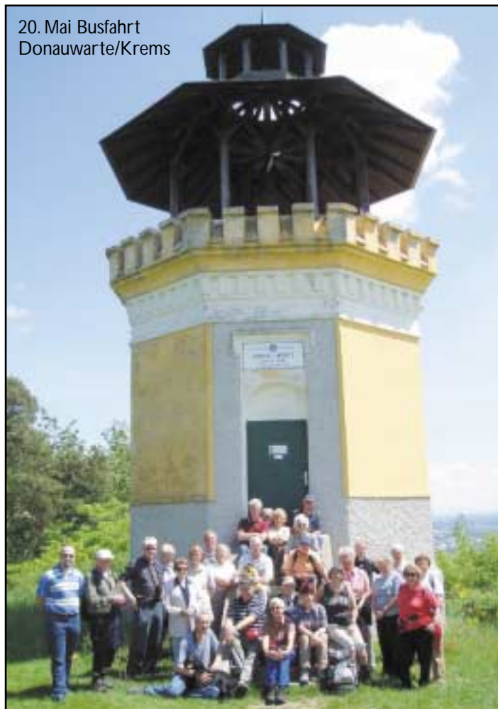
20. Mai Busfahrt Donauwarte/Krems

Donnerstag, 7. Juni Wolkersdorf – Radroute „Zweigelt“