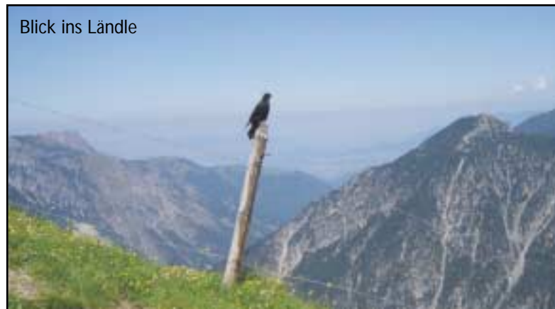
Blick ins Ländle

Für die angemeldeten Teilnehmer wird eine gemeinsame Vorbesprechung stattfinden.