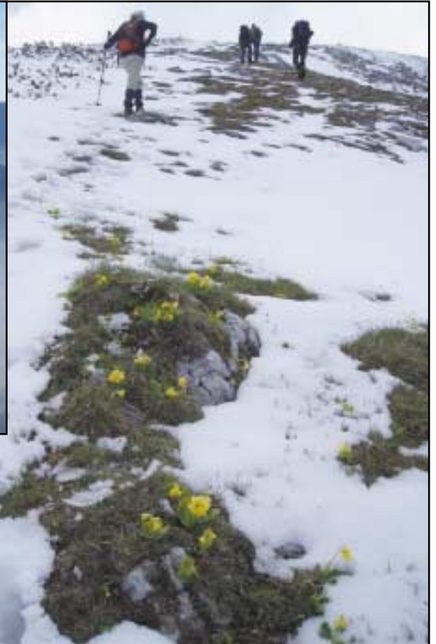
8. Juni, ein Winterbild? Jein: Bergtour Wildkamm – Veitsch

Eine steile Rinne sollte es werden. Schwierigkeit III - IV, FB 25 €.