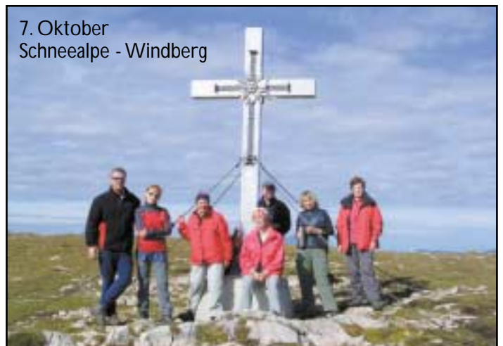
7. Oktober Schneealpe - Windberg